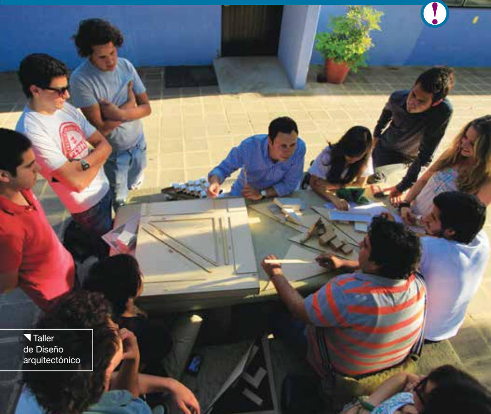
▼ Taller de Diseño arquitectónico

El ITESO, sus alumnos y profesores participan activamente en programas de desarrollo urbano sustentable.