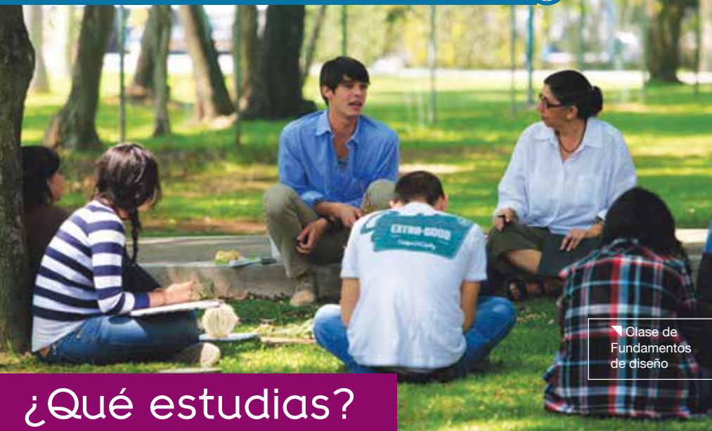
Clase de Fundamentos de diseño

Aprendes de arquitectos destacados por sus trayectorias profesionales y prestigio académico. !