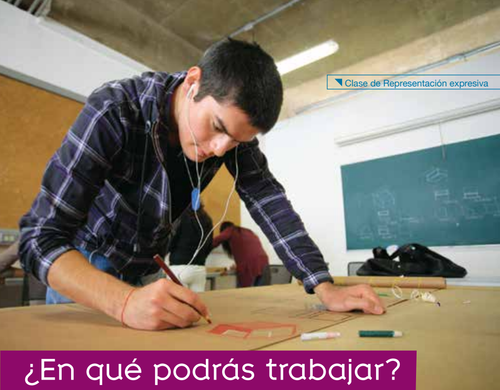
▼ Clase de Representación expresiva