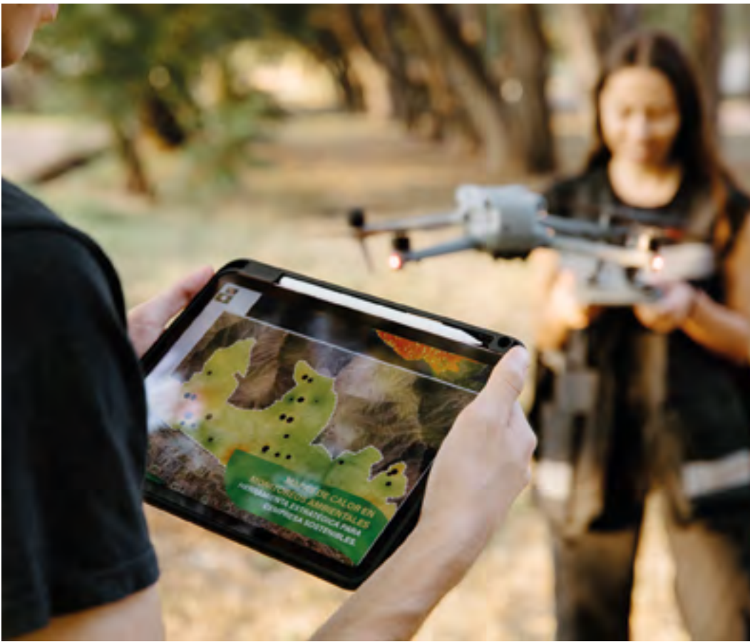
VIDEO DE LA CARRERA